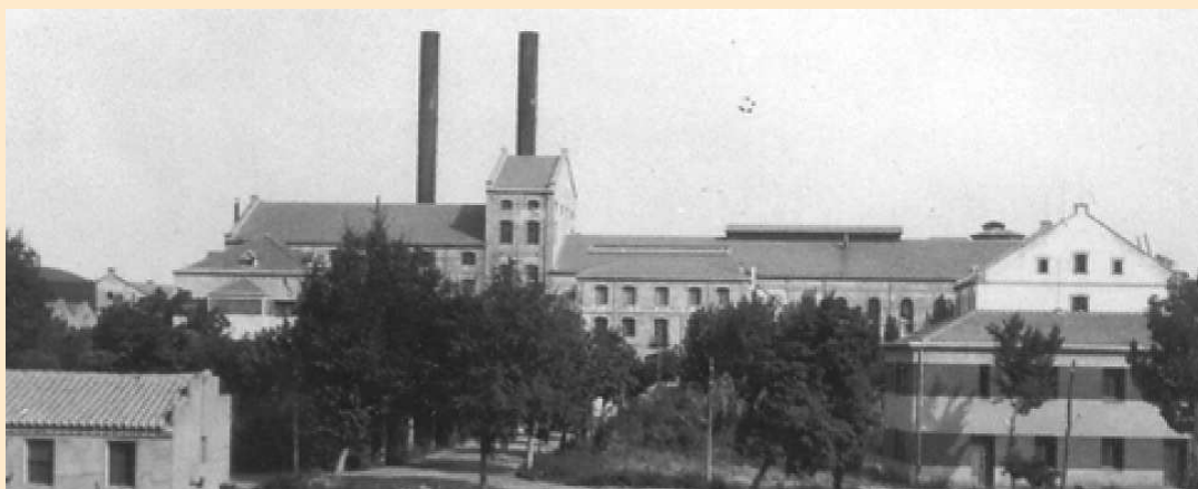
Vista general de la azucarera

ampliación del número de fábricas, con graves perjuicios para agricultores y fábricas, que presionaron hasta conseguir en 1911 que la ley se derogase. Tras ello, la provincia de Teruel comienza su desarrollo en el sector y el año siguiente, 1912, se instala la azucarera de La Puebla de Híjar.