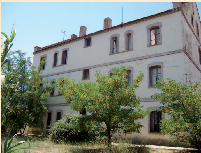
Vivienda del director, uno de los escasos vestigios conservados de la azucarera

pendular desde las tierras del sur hacia las del norte en las primeras décadas, y del norte hacia el sur en los años sesenta, provocado por el cierre de unas fábricas y el traslado y/o montaje de otras. Una curiosidad: con la llegada de gentes del Ebro al entorno de Jerez se comenzó a cultivar la borraja, verdura muy apreciada en la depresión del Ebro y desconocida y ausente en la cocina andaluza.