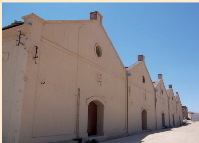
Antiguas naves de silos de la azucarera, hoy reutilizadas

las máquinas de vapor. El montaje de esta fábrica, al margen de las innovaciones, se hizo con la maquinaria de la azucarera de Padrón (La Coruña) que había sido cerrada por contar con poca materia prima y los rendimientos en sacarosa muy bajos. En este caso, se dejaba de cultivar un producto que no había logrado consolidarse y se olvidó fácilmente, mientras que la producción hortícola se asentaba con el cultivo de los pimientos.