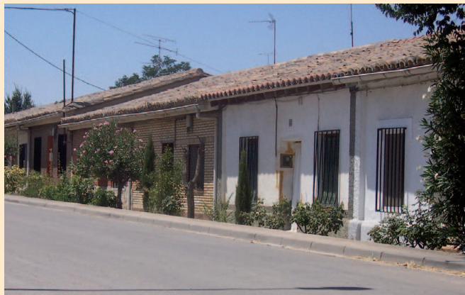
La Puebla de Híjar. Azucarera. Viviendas obreras

El problema interno, generado por la superproducción, produjo un enfrentamiento entre los monopolios azucareros. La Sociedad General Azucarera amenazó en 1934 y 1935 con cerrar la azucarera de La Puebla de Híjar,