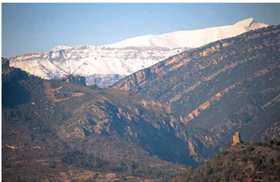
Castillos de Samitier y Escanilla

Respecto a la ocupación del espacio de Sobrarbe entre los siglos VIII-IX, parece producirse un aumento en el número de asentamientos, conformando un hábitat disperso, pero que no conllevaba unos rendimientos óptimos, lo que favorecía cierta labor repobladora por gente de los valles más septentrionales de Sobrarbe, en las tierras más aptas, al sur, en el Valle del Guarda y en las «Balles» más meridionales (Ribera de Fiscal, valle de Solana, de Puertolas), donde se establecen nuevos asentamientos de carácter defensivo, cercados por un «muro», mencionados ya en el siglo X (« Muro de Valle » o de la Solana sobre el río Ara; Muro de Bellos en la confluencia del río Yesa y del Cinca, y « Muro Maior » o de Roda, sobre el río Cinca, dominando la Fueva. Sistemas defensivos parecidos se descubren en Gabarre, Espierlo, San Salvador de Charo, el Pueyo de Griegal, etc...), con esta misma función surgen las denominadas « torre », que ya se ubican en la zona prepirenaica de la comarca (Latorre en Castejón de Sobrarbe y en Pallaruelo, Latorrecilla, las « Torreyllolas » (Torrolluala del Obico y Torruellola de la Plana) o « Turricella », al pie de la Sierra Ferrera).