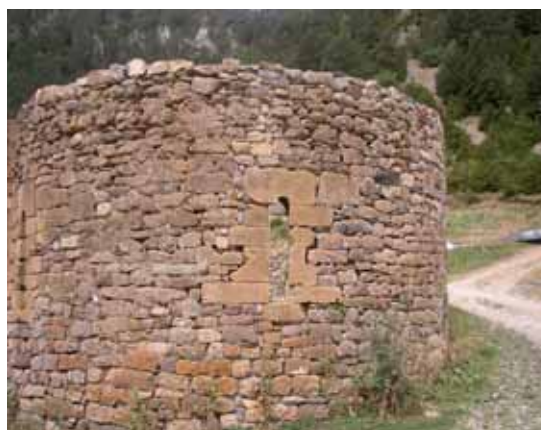
Restos del hospital de San Nicolás de Bujaruelo

concesión por Alfonso II de franquicias a los mineros que acudieron a explotar las minas de plata a Bielsa, obteniendo un nuevo privilegio en 1277 de Pedro III. Dichas explotaciones mineras eran propiedad del rey, que arrendaba la extracción del mineral y su transformación en las « ferrerías ». La producción se utilizó en Sobrarbe y se exportó hasta Cataluña, como reflejan los libros de la aduana de Monzón. Se calcula que a mediados del siglo XV, la producción ascendía a unos 120-150 quintales anuales, de los cuales 40-50 iban a Cataluña.