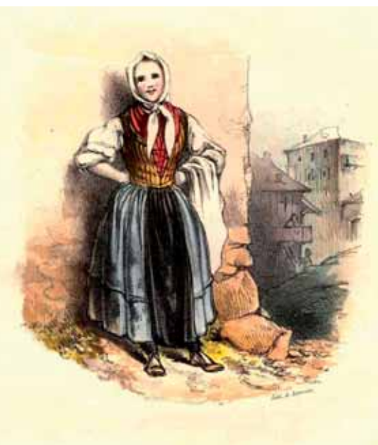
Sierva del valle de Gistain

permiten. La vida de cada lugar se rige desde el siglo XIII, por la asamblea vecinal o Concejo, donde se hallan presentes todos los vecinos del lugar, sobre los cuales se sitúa un delegado del rey –el Justicia– o del señor. También constituían, favorecidos por la propia geografía del Sobrarbe, en el área más pirenaica, una agrupación de lugares sitios dentro de un valle geográfico, como mancomunidad para la explotación de tierras comunes, el Quiñón (Quiñón alto y bajo del Valle de Vio) o el Valle de Broto.