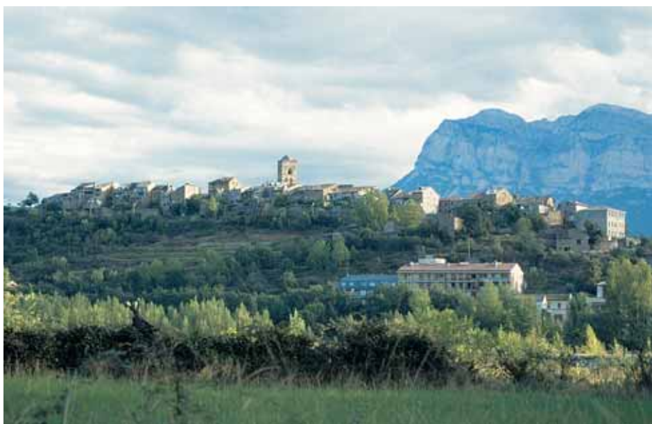
Alfonso I concede en 1127 a la villa de Aínsa los fueros que poseía Jaca

cas y económicas del Sobrarbe, se producen algunas actuaciones, como la concesión por Alfonso I a la villa de Aínsa en 1127 de los fueros que poseía Jaca, a fin de crear un núcleo urbano que estructurara la comarca. En diciembre de 1191, Alfonso II concede carta de población a 14 mineros en un lugar en el término de Bielsa, para explotar las minas de plata allí existentes, y les permite construir un castillo, villa y molinos para sus labores de extracción, regidos según « consuetudinem Barchinone ».