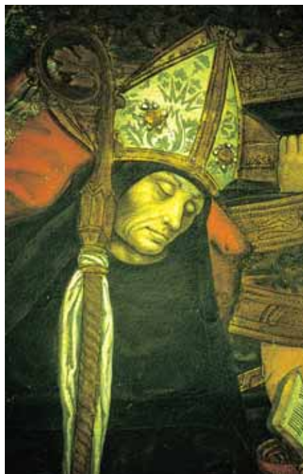
Imagen de San Victorián

sa, que domina la provincia Tarracense hispano romana, a la cual pertenecía Sobrarbe. Aunque la presencia visigoda supone una ruptura política respecto a Roma, su grado de asimilación de la cultura romana y su escaso número frente a la población indígena, les induce a mantener las infraestructuras administrativas bajoimperiales. En Sobrarbe puede observarse tal hecho en un texto datado el 29 de septiembre del 551, donde el diacono oscense Vicente dona varias propiedades al monasterio de Asán y a su abad Victorián. Dichas propiedades se dispersan en diferentes distritos o « terrae », como la « terra boletana », la « terra terrantonsi », la « terra barbotana », y la « terra labeclosana » que comprenden un espacio más amplio de lo que hoy es Sobrarbe.