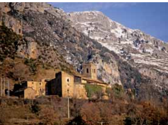
El breve Gonzalo será enterrado en el Monasterio de San Victorián