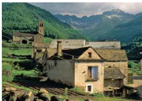
Linás de Broto y Aínsa eran las únicas poblaciones que superaban los 100 fuegos en el siglo XV

La distribución espacial de los asentamientos en Sobrarbe a finales de la Edad Media va a mantenerse, con algunas variaciones –nuevo abandono de lugares en el siglo XVII– hasta el siglo XX. El censo de fogajes realizado tras el acuerdo por las Cortes del Reino de Aragón en Tarazona en 1495, ofrece algunos datos, incompletos, sobre la población de Sobrarbe: en él aparecen relacionados 119 lugares, distribuidos entre las «sobrecollidas» de Aínsa y de Barbastro, que suman 2036 fuegos –a los que añadir un cierto número de «fuegos» exentos, no citados–, con una población muy dispersa en núcleos que no llegan a los 10 «fuegos», donde sólo Linás de Broto y Aínsa superan los 100 «fuegos» (112 y 106 respectivamente). Los lugares con mayor número de población suelen ser los sitios en valles septentrionales (Valle de Broto), vinculados a la ganadería.