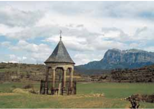
La cruz de Sobrarbe, en Ainsa, al pie de Peña Montañesa

Pamplona, acampa en el «país de Ibn Balaskut», el cual se ha identificado con un tal Galindo Belascotenes, adalid de un linaje de posible stirpe visigoda, asentado en dicha «Sartaniya» quien solicita del Califa el «amán» (paz) y entrega un hijo como rehén. A fines del siglo VIII, la presión musulmana y carolingia, tras las expediciones de Carlomagno sobre Zaragoza, fuerzan a los «sirtaniyyin» a aceptar la presencia del conde franco Aureolo en dicho territorio prepirenaico, mientras que el Valle de Gistau es sometido