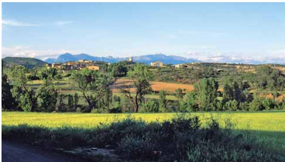
En las cercanías de Paüles de Sarsa, en la Cueva Foradada, se halló una cámara funeraria perteneciente al siglo VIII

La crisis del reino visigodo de Toledo en la segunda mitad del siglo VII y comienzos del siglo VIII fue agravada por sucesivas expediciones norteafricanas desde el 711, que victoriosas, se instalan en la Península Ibérica, hacia el 720 alcanzan el Valle del Ebro y atraviesan los Pirineos, hasta ser detenidos en su avance en el 732 ante la ciudad gala de Poitiers. Aunque en los primeros momentos los invasores musulmanes obtienen el control del territorio rápidamente, con la sumisión y alianza de los líderes locales, los conflictos provocados por las revueltas de las tribus beréberes, instaladas en el N. de la Península, provocan