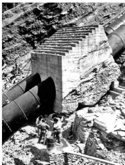
La central de Lafortunada sería objeto de una acción de sabotaje por parte del maquis

Todas estas caídas suponían el principio del fin, pues cada vez se oían menos cosas acerca de los maquis y llegó un momento, en 1952, en que