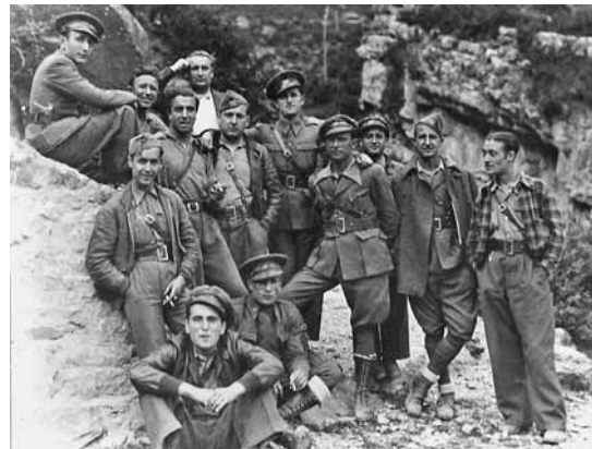
Tropas de la 43 División Republicana en el Alto Aragón

La represión encontró múltiples matices a lo largo de los tres años de conflicto y durante todo el régimen posterior. En los inicios de la sublevación quienes primero sufrieron las más duras represalias fueron los militares profesionales declarados republicanos, los líderes políticos y las personas civiles con gran importancia dentro de la intelectualidad española. A esto se sumaron las matanzas colectivas o bombardeos que a lo largo de toda la guerra llegaron a producirse y los ajusticiamientos o detenciones de líderes políticos y