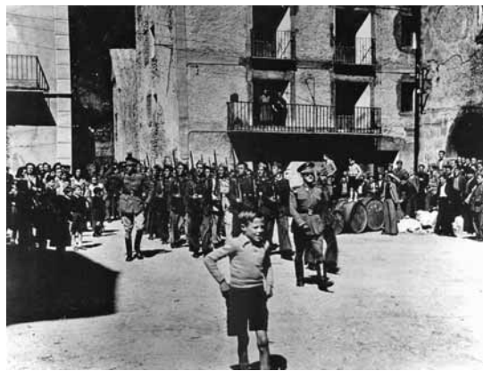
Entrada de las tropas franquistas en Bielsa

La posguerra española también se convirtió en una época de importantes cambios económicos, traducidos principalmente por el estricto control regido por la Fiscalía Provincial de Tasas, institución creada con el objetivo de supervisar la economía agrícola de las zonas rurales. Pero para que la tarea de esta fiscalía quedase plenamente desempeñada, dependían de ella otras como la Comisión General de Abastecimientos y Transportes, encargada de controlar el almacenaje y la compra-venta de productos agrícolas, y el Servicio Nacional del Trigo cuya función descansaba en actuar como intermediario entre los productores individuales y las harineras con el fin de que no se produjesen fraudes. Si algún molinero del Sobrarbe resultaba sospechoso por moler más trigo del que tenía estipulado, enseguida pasaba a estar bajo vigilancia y si llegaba el caso de que acudía al molino algún vecino a altas horas de la noche con