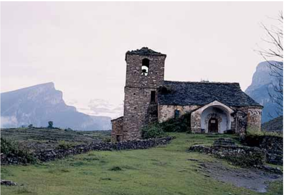
Iglesia de Vio

Aunque todo el espacio comarcal –más de 2.000 kilómetros cuadrados– es montañoso, el relieve, atendiendo a su vigor, puede agruparse en tres bandas: la situada al norte cuenta con numerosas cimas que superan los tres mil metros de altitud, en el centro se abre una cubeta con alturas que oscilan entre quinientos y seiscientos metros, al sur los montes se alzan por encima de los mil metros pero sin alcanzar los dos mil. La separación con los territorios vecinos resulta orográficamente muy nítida y viene marcada, casi siempre, por líneas de cumbreros que dibujan con claridad las rayas fronterizas.