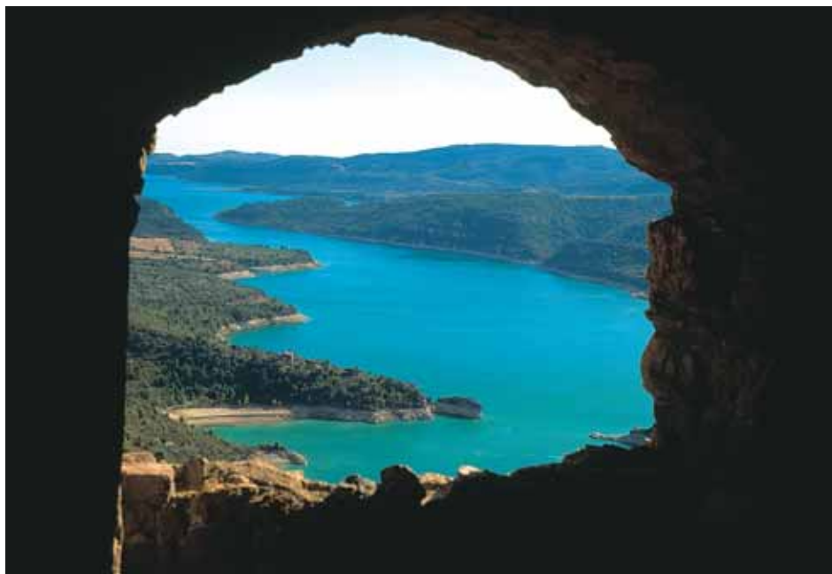
Imagen del embalse de El Grado tomada desde el despoblado de Clamosa

La naturaleza ha sido como en ningún otro sitio la forjadora de una comarca enclavada en lo más agreste y duro del Pirineo, las imponentes montañas del norte rivalizan con la aspereza de los intrincados desfiladeros de la sierra de Guara por el sur. Ambas moles rocosas dejan entre medio un espacio surcado por manojos de ríos que van a parar al más importante de los cursos pirenaicos: el Cinca, verdadero eje de intercambio de ideas, gentes y recursos a través de los siglos y que consolidó a esta comarca como un ente territorial natural, más allá de divisiones administrativas más o menos artificiosas.