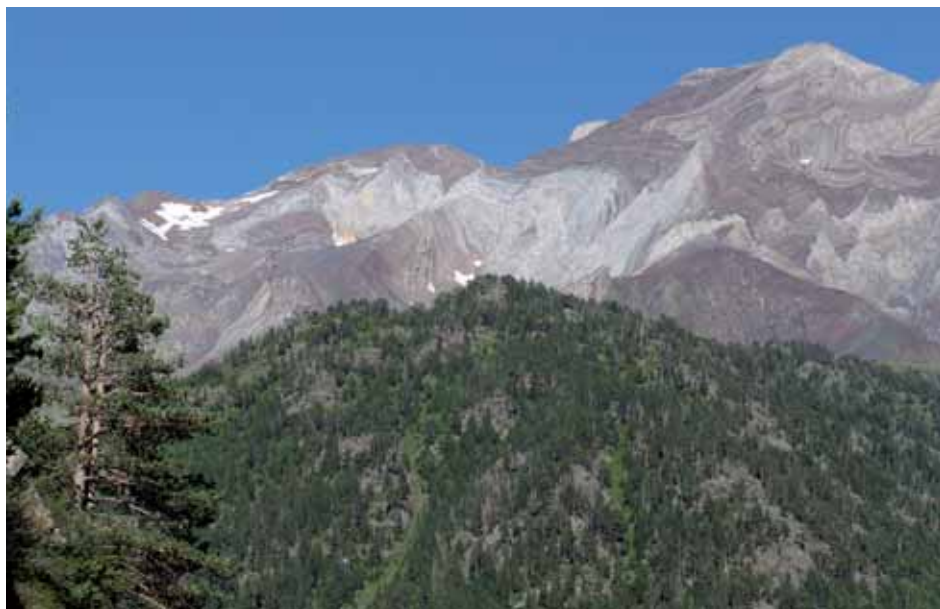
Complejidad litológica en el alto valle de Gistain

habitantes y la mayoría tienen menos de quinientos repartidos, casi siempre, en muchos núcleos de población diminutos.