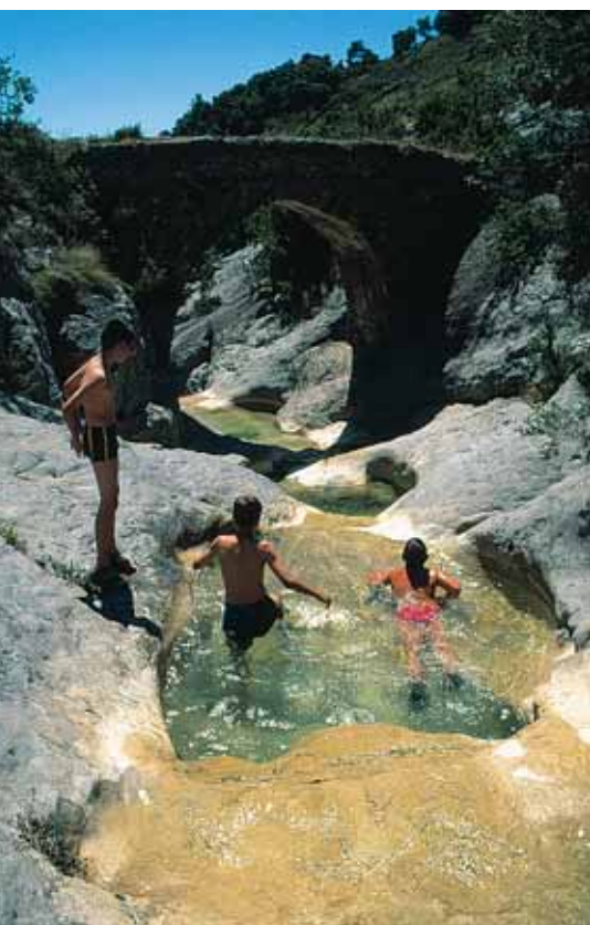
Pozas del barranco de Ascaso, en la cuenca del Ara

El sustrato geológico es calcáreo en la mayor parte del territorio. Sólo en el extremo nororiental de la comarca aparecen las rocas ígneas y metamórficas, en el resto todo lo que aflora es sedimentario: calizas en las cumbres más vistosas (Monte Perdido, Peña Montañesa), areniscas y margas en la depresión del corazón de Sobrarbe, calizas –de nuevo– y conglomerados en el sur.