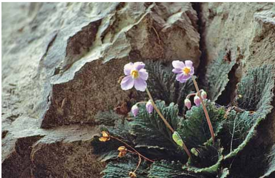
Flora alpina en Añisclo

gran potencial turístico que tenemos, desde la Comarca de Sobrarbe se apuesta por la diversificación y desestacionalización de la actividad productiva basada en el aprovechamiento de los recursos agroganaderos y forestales y por desarrollar un turismo de calidad.