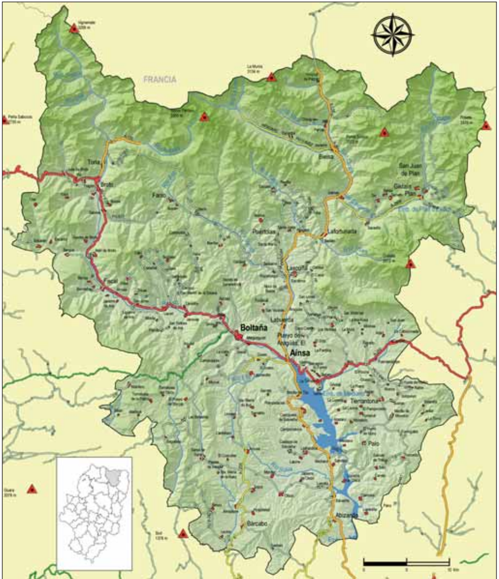
Mapa de la Comarca de Sobrarbe