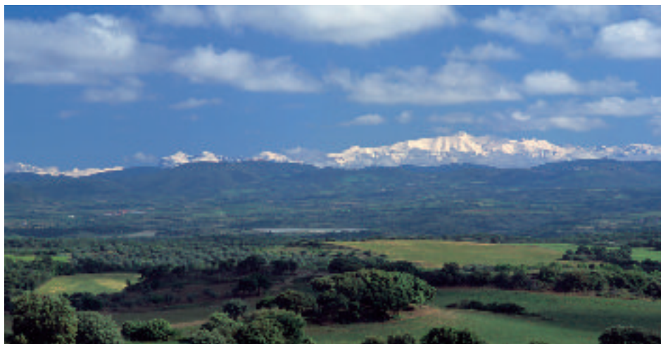
Paisaje de la comarca del Somontano

que han ayudado a activar nuestros pueblos, con la expansión de la viticultura y las bodegas a partir de la creación de la Denominación de Origen de los vinos del Somontano; con el impulso de Barbastro y el auge de sus servicios, o a través de las crecientes oportunidades turísticas vinculadas a la Sierra de Guara, el Parque Cultural del Río Vero y el patrimonio cultural; pero sobre todo con la ilusión y el trabajo de sus habitantes. Se trata de unos procesos que han potenciado y potencian el desarrollo de los diferentes sectores económicos junto al cuidado y a la vez puesta en valor del patrimonio cultural y el medio ambiente de la comarca.