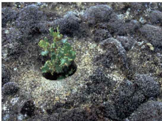
Plantón de coscoja

En estos últimos quince años el Somontano ha visto ampliadas sus perspectivas de futuro gracias al impacto de las medidas de desarrollo rural, tras la gestión de programas europeos como Leader II y Leader Plus ,