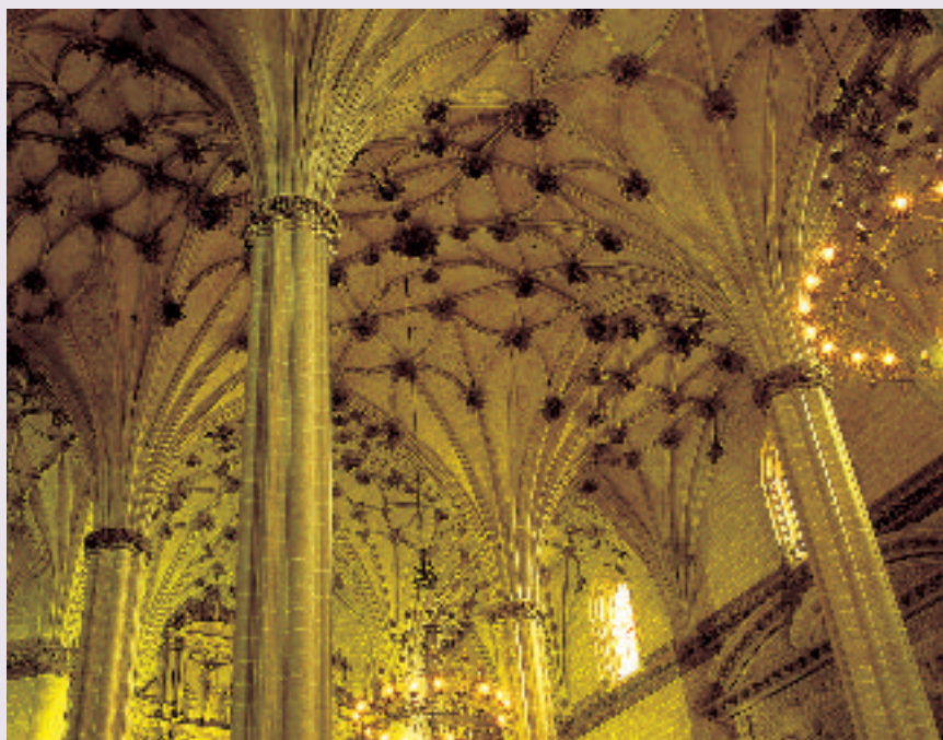
Bóvedas de la catedral de Barbastro

La ciudad de Barbastro ha ejercido un importante papel aglutinador de este territorio desde su origen, consecuencia de un proceso de organización territorial que se consolida en el medievo. Tras su fundación a finales del s.VIII como fortaleza, en el proceso de protección de la frontera septentrional de la Marca Superior de Al-Andalus, en el siglo IX ya es una importante ciudad islámica, capital de la región de la Barbitaniya. Desde entonces, desde hace más de mil años hasta hoy, Barbastro se ha convertido no sólo en la capital del Somontano, su territorio inmediato, sino en cabecera de una buena parte del sector oriental de la provincia de Huesca y sus valles pirenaicos. Su carácter de sede urbana y centro comercial se ve validado constantemente, desde el primitivo zoco árabe a la ciudad medieval que recibe de los reyes de Aragón, como Pedro I o Pedro IV, privilegios de feria y mercados. El más significativo será el derecho de feria otorgado en 1512 por Germana de Foix, segunda esposa de Fernando el Católico, otorgando la Feria de la Candelera, celebrada sin interrupción hasta hoy y referencia económica y sociocultural. A ello se irán sumando las diferentes disposiciones sobre ferias y mercados durante las edades Moderna y Contemporánea, que