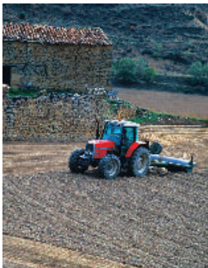
Laboreo agrícola en tierras de secano

En el Somontano se dan paisajes agrícolas variados debido a la diferenciada distribución de los cultivos según las características del medio físico y de la existencia o no de riego, entre otras razones. Puede decirse que predominan los cultivos herbáceos en las zonas centro y sur de la comarca, mientras que los leñosos son más abundantes a partir de la mitad septentrional. La agricultura en el Somontano es predominantemente de secano ya que del total de tierras de cultivo, tan solo se riega un 29,46%, dedicándose el 70,54% restante a cultivos de secano. Según datos de 2005, los herbáceos ocupan la mayor parte de la superficie cultivada, con un 51%. Los leñosos ocupan el 21,50% y los barbechos y retiradas el 27,50% restante.