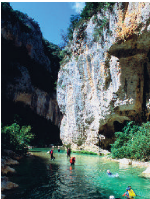
El barranquismo , motor económico de los municipios de la sierra

Quizás uno de los principales retos del Somontano hoy es que Barbastro y el resto de los municipios «vayan de la mano» en el proceso de promoción del desarrollo y la competitividad del territorio. Esta comarca tiene en su haber valores y experiencias que proporcionan un buen bagaje en este campo, del que son muestras por ejemplo: el intenso entramado de relaciones sociales, culturales y económicas trazado a lo largo de la historia entre la cabecera y el resto de