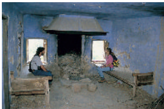
Antigua cocina en el núcleo deshabitado de San Hipólito (San Póliz)

Esta configuración es el resultado de la dinámica demográfica experimentada en el último siglo. Desde principios del siglo XX el territorio ha ido perdiendo población de forma paulatina como resultado, principalmente, de la emigración de sus habitantes. Todos los municipios de la comarca excepto Barbastro han perdido población a lo largo del siglo XX, y especialmente en los años 60 y 70.