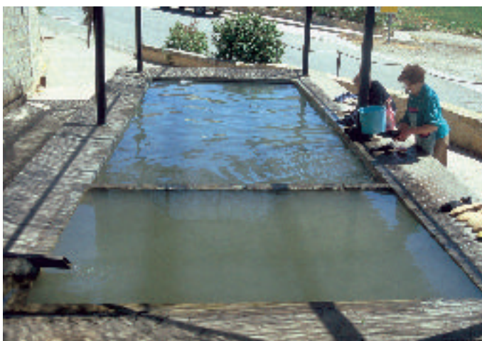
En el lavadero de Estada

Sin embargo, si el proceso de envejecimiento es en un principio consecuencia directa de la pérdida de población, se ha convertido posteriormente en una de las causas que «retroalimenta» la despoblación del territorio. El incremento de la proporción de personas ancianas que tienen mayores probabilidades de fallecer trae como consecuencia el mantenimiento e incluso el incremento de las tasas de mortalidad.