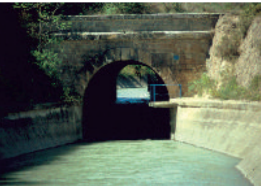
Estada. Túnel en el Canal de Aragón y Cataluña

del Somontano mediante los canales de Selgua y Barbastro, extendiéndose en torno a 3.000 ha. Concretamente, los municipios que se riegan con estas aguas son Barbastro, Berbegal, Castejón del Puente, Ilche, Laluenga, Laperdiguera, Peraltilla, Peralta de Alcofea y Torres de Alcanadre. Por su parte, los municipios de Olvena, Estada y Estadilla se benefician de las aguas del Canal de Aragón y Cataluña, que desde 1906 ha ido aumentando progresivamente su superficie regada hasta llegar a unas 2.000 ha.