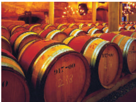
Denominación de origen del Vino «Somontano» Crianza en barricas

También hoy gracias al vino, el Somontano se conoce en el exterior y su imagen se asocia a prestigio y calidad, y es una muy buena «carta de presentación» del territorio. Por último, el vino del Somontano está mostrando una capacidad extraordinaria para generar sinergias con otros recursos y sectores mediante acciones como la acogida de más de 15.000 visitantes al año en las bodegas, la creación de un espacio museístico y un comercio especializado junto a la Oficina de Turismo de Barbastro y el Centro de Interpretación de la Comarca, o la organización anual, mediante un programa acogido a la iniciativa comunitaria INTERREG III A, de un festival de música de alto nivel que acompaña de acciones de promoción de la hostelería y otros productos agroalimentarios de la zona.