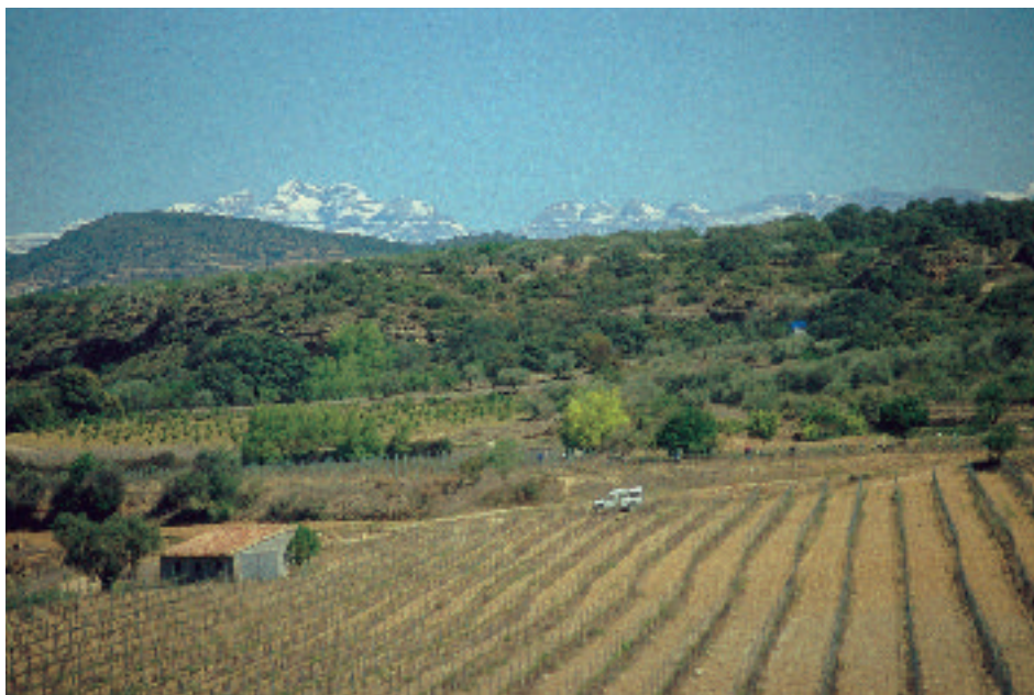
Nuevos viñedos en la zona de Olvena, orilla izquierda del Cinca

mas décadas. Las mayores extensiones de viña están en Basbastro y municipios limítrofes, como Salas Altas y Salas Bajas. Allí se concentra más del 60% de la producción de uva. También es importante en Pozán de Vero, El Grado, Hoz y Costean, Lascellas-Ponzano e Ilche, cerca de las bodegas transformadoras. Una parte de las nuevas plantaciones se están realizando en parcelas de regadío con el objeto de disponer de riego de apoyo, de hecho, la tercera parte de la superficie de viñedo es hoy de regadío, a pesar de tratarse tradicionalmente de un cultivo de secano.