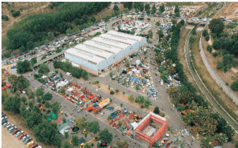
Institución Ferial de Barbastro (IFB). Vista aérea del recinto ferial

La Institución Ferial de Barbastro , es la entidad promotora y organizadora de los certámenes feriales que han sido desde antiguo un factor dinamizador de la economía y el desarrollo comarcal.