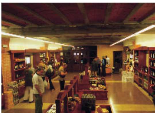
Tienda de productos comarcales

Las localidades del entorno de la Sierra de Guara concentran la mayoría de las empresas turísticas. El binomio «barrancos y patrimonio» que reúne Alquézar fue el germen del posterior desarrollo turístico de la zona. Pionero en disfrutar de sus atractivos fue el turista francés, especialmente con la práctica del barranquismo; en la actualidad el país vecino sigue siendo un mercado emisor muy importante. Otros municipios que cuentan con una interesante oferta hostelera son Bierge y Colungo, y ya fuera del Parque, El Grado y Naval. Como aportación a la economía comarcal, hay que destacar la creación de