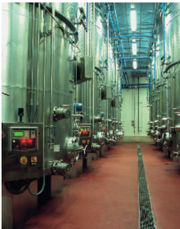
Interior de una bodega

La construcción también es un sector muy dinámico en la comarca. En esta actividad tra-